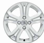
Jante aliaj 16" Diamantees Blanc Banquise