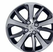
Jante aliaj 17" Diamantees Technical Grey