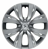
Capace roti 15" Chrome - (Active)