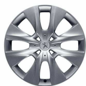
Capace roti 15" Bore - (Access)