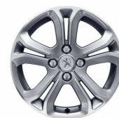
Jante aliaj 16" Diamantees Gris Hephaïstos