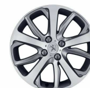
Jante aliaj 17" Diamantees Gris Hephaïstos