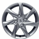
Jante Aliaj 15" Azote