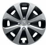
Capace roti Iridium 15" - (Active 1.4 HDi Robotizata)