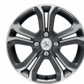
Jante aliaj 16" Diamantees Technical Grey